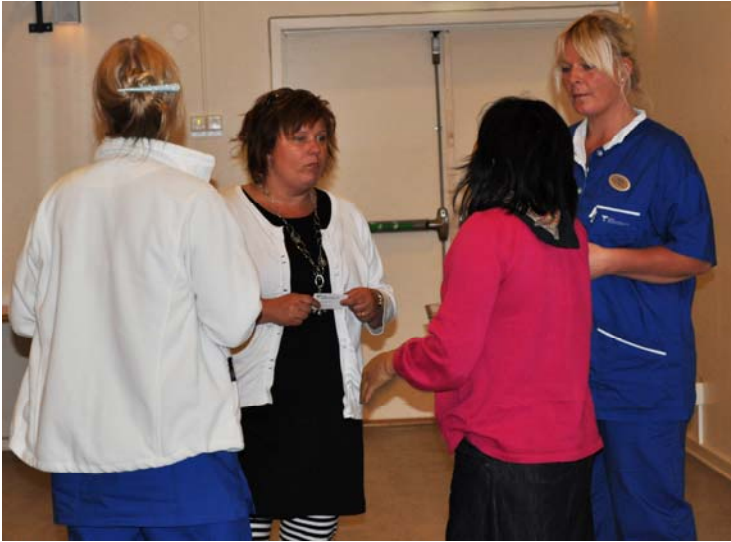
Diskussioner i pausen